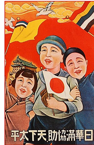
Пропагандистский плакат «Союз Японии, Китая и Маньчжоу-Го принесёт миру мир»